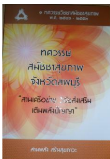
หนังสือถอดบทเรียน “สมัชชาสุขภาพลพบุรี”

นับเป็นความชาญฉลาดของพี่น้องชาวลพบุรี ที่รู้จักใช้ “สมัชชาสุขภาพ” ให้เป็นเครื่องมือพัฒนา และขับเคลื่อนนโยบายสาธารณะเพื่อสุขภาพ ในโลกแห่งความเป็นจริง คือใช้กับเรื่องที่เป็นจริงในพื้นที่ ใช้ อย่างต่อเนื่อง ขยายผลและขยายวงออกไปเรื่อยๆ ไม่ใช่การทำตามทฤษฎีหรือแนวคิดในกระดาษ ไม่ใช่ การจัดสมัชชาสุขภาพ เพียงแค่เวทีประชุมหามติ แล้วจบเพียงเท่านั้น แต่เขาใช้สมัชชาสุขภาพเป็น เครื่องมือหนึ่งเสริมงานขับเคลื่อนต่างๆ ที่มีอยู่แล้ว ให้มีพลังเพิ่มขึ้น ให้มีความสำเร็จที่มากขึ้น กระบวนการสมัชชาสุขภาพอย่างนี้ น่าจะตรงกับที่บางคนเรียกว่า “สมัชชาสุขภาพกินได้”