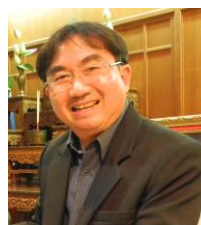
คุณหมอนพพร